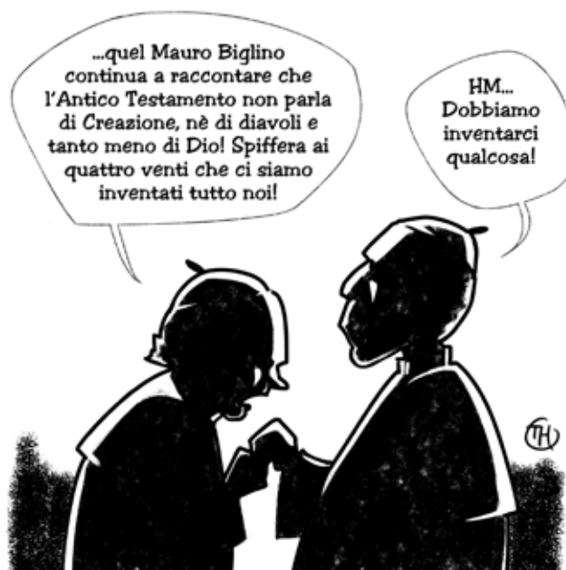
-IL FANTASY AL POTERE-

Chi scrive non ha mai sentito Biglino citare il metodo storico-critico,